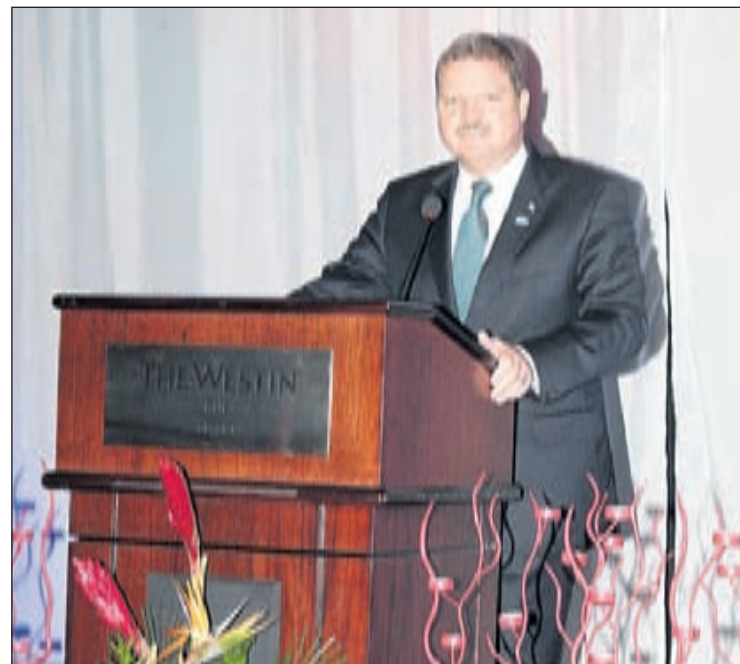
Minister Mike Eman

Y tin motibo pakico mester haci e esfuerzo. Turismo for di Europa a crece cu 7.7 porshento na 2011, danki entre otro na aumento di promocion y contribucion di e partnernan Europeo. Turismo di Italia a crece cu no menos cu 127 porshento, mientras cu bishitantenan for di paisnan Scandinavo a aumenta cu 15 porshento. Pa motibo aki mes lo sigui enfoca esfuerzo riba e mercado Europeo, particularmente paisnan cu economia mas fuerte. E crecemento proyecta pa 2012 ta 4 porshento, basa riba un aumento considerable di 10 porshento den inversion ATA pa mercadeo. E ta parti di e suma cu ATA tin adicionalmente na su disposicion. Mester bisa cu na 2011 ATA a logra un entrada for di e impuesto